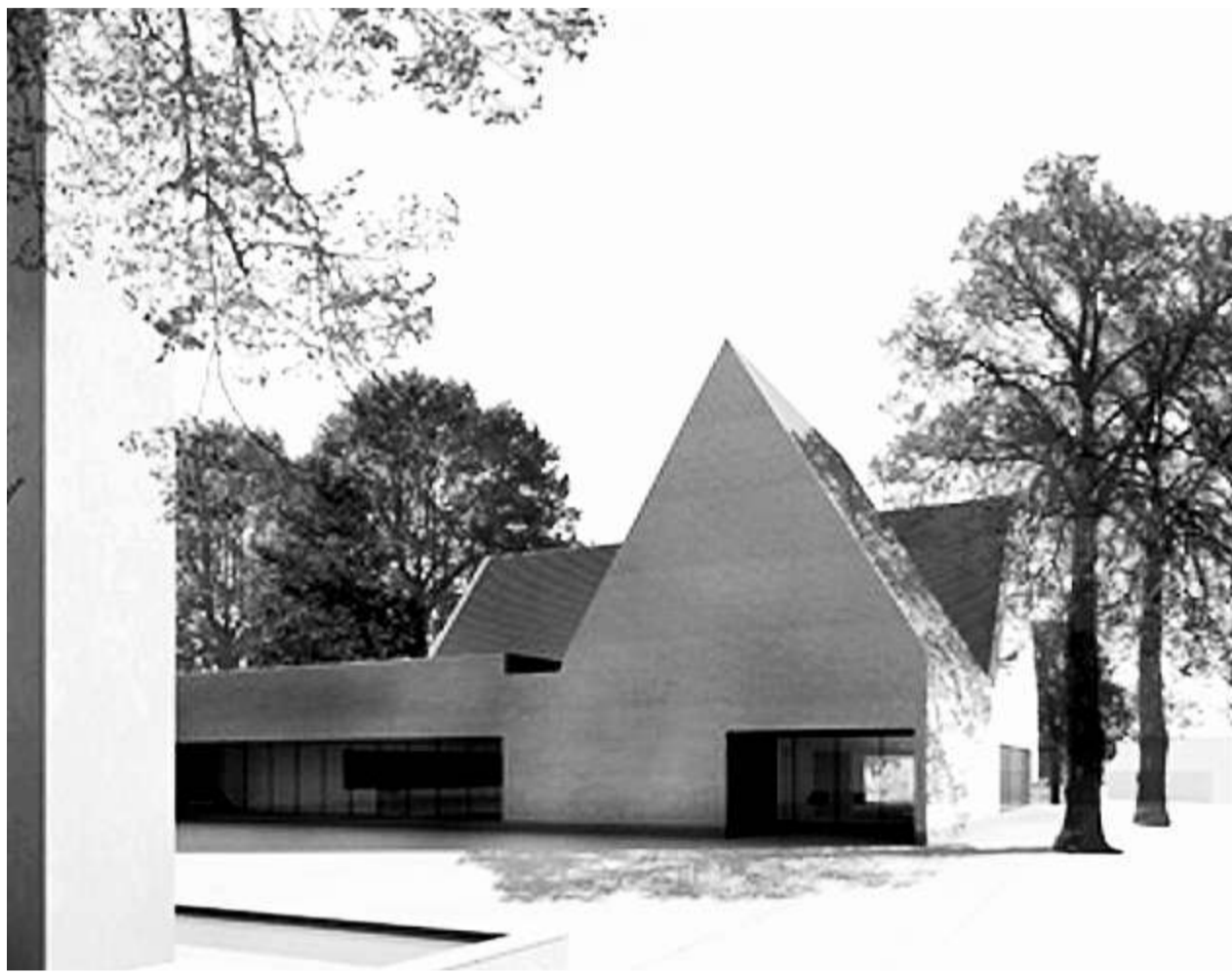
Ob die Stadthalle nach den Plänen von Bayer & Strobel einmal so aussehen wird, entscheidet sich in den nächsten Wochen.