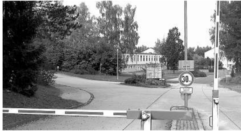
Wie geht's weiter mit der Konversion des Kasernengeländes am Plattenberg?

Nach einer detaillierten Untersuchung hoffe man, schon in nächster Zeit über fundiertes Zahlen- und Datenmaterial zu verfügen. Bayerl wörtlich: „Wir werden uns zusammensetzen und gemeinsam versuchen, die Probleme