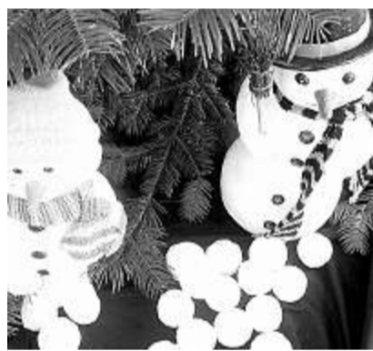
Morgen ist Neunburger Wintermarkt!